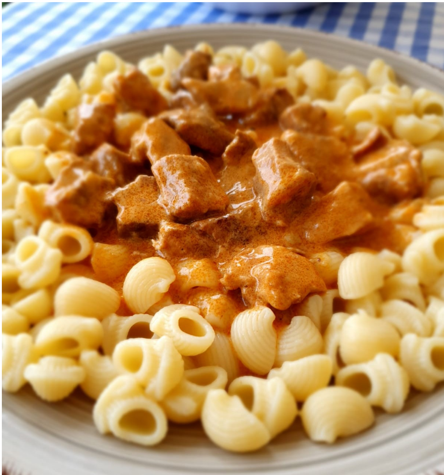
Pikantais sautējums sātīgām pusdienām. Un ja pagatavosiet vairāk, būs arī vakariņām.