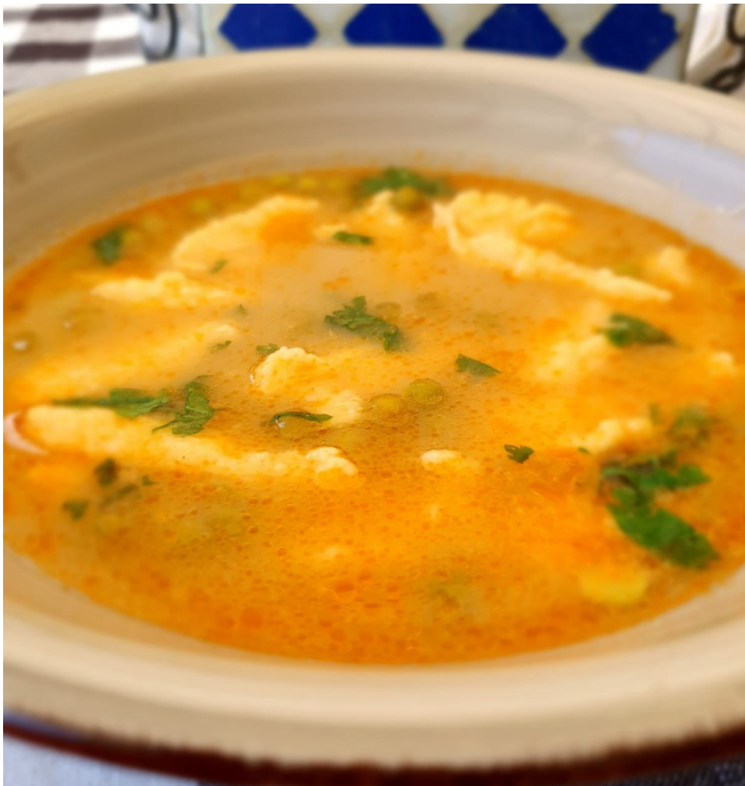
Viena no manām mīļajām, ātrajām un gardajām!!!